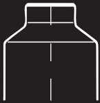
Flachsulter Flat shoulder Epaulement plat

Die Talc Can mit ihrem Spezialitätencharakter ist im Besonderen auf die Eigenschaften von kosmetischem Puder abgestimmt. Mit ihrer edlen Optik und ihrer ästhetischen Form wird sie zum Blickfang in jedem Badezimmer.